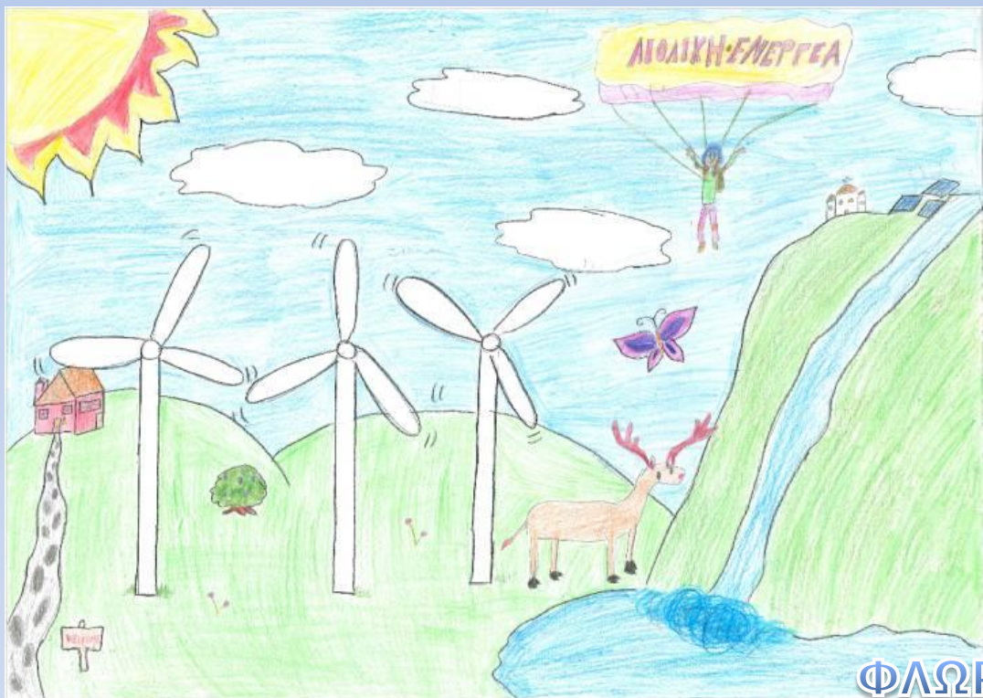
ΦΛΩΡΕΝΤΙΑ ΔΗΜΗΤΡΟΠΟΥΛΟΥ – ΣΤ2