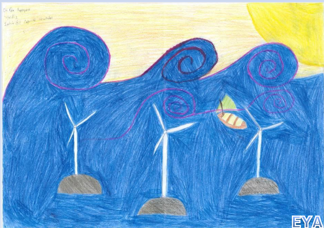
ΕΥΑ ΜΑΡΜΑΡΑΚΗ – Δ2